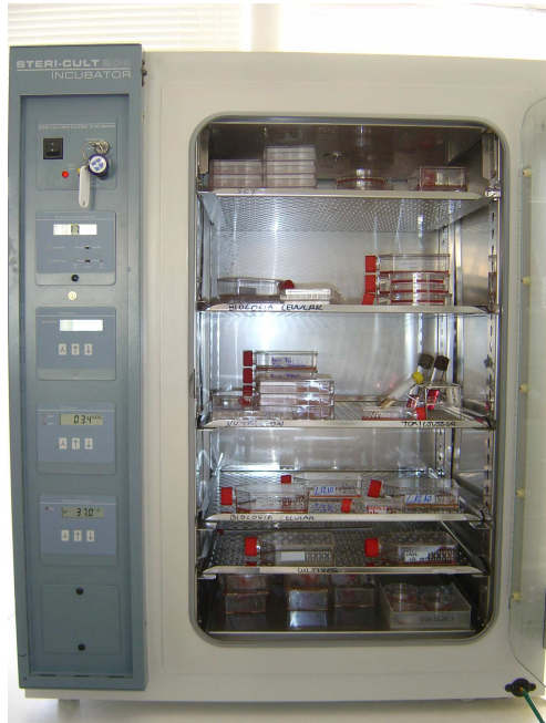
Forma Scientific mod. Stericult